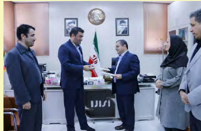
اداره کل فرهنگ و ارشاد اسلامی کردستان

در راستای اجرای قانون تقویت و توسعه نظام استاندارد و با هدف تشریک مساعی در زمینه اجرای قانون تقویت و توسعه نظام استاندارد، ترویج استاندارد، ارتقاء کیفیت کالا و خدمات و انجام فعالیت های آموزشی و پژوهشی مرتبط در راستای استفاده بهینه از توانایی های علمی، فنی و پژوهشی طرفین و هماهنگی در خصوص تسهیل اجرای بندهای قانون تقویت و توسعه نظام استاندارد، در سال ۹۷ تفاهم نامه همکاری استاندارد کردستان با دادگستری و اداره کل فرهنگ و ارشاد اسلامی کردستان این استان منعقد شد.