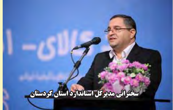
سخنرانی مدیرکل استاندارد استان کردستان