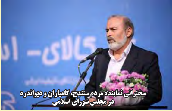
سخنرانی نماینده مردم سنندج، کامیاران و دیواندره در مجلس شورای اسلامی