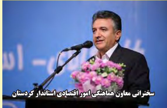
سخنرانی معاون هماهنگی امور اقتصادی استاندار کردستان