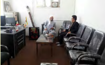
دیدار با امام جمعه دیواندره