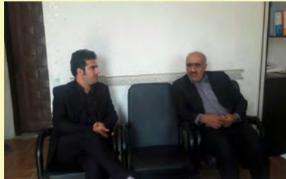
دیدار با رئیسی ستاد احیای امر به معروف و نهی از منکر دیواندره