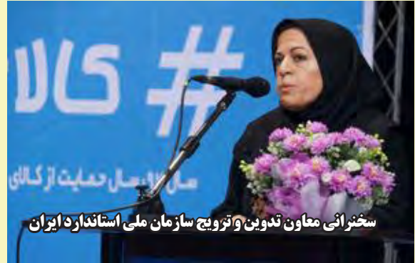
سخنرانی معاون تدوین و ترویج سازمان ملی استاندارد ایران