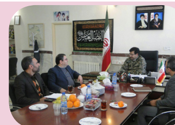
دیدار با فرماندار بیجار