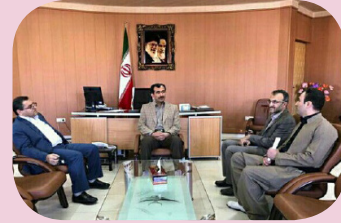
دیدار با فرماندار بانه