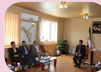
دیدار با فرماندار سروآباد