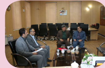
دیدار با فرماندار سقز