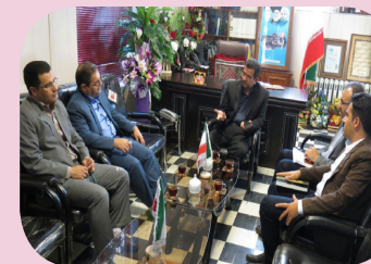
دیدار با فرماندار دیواندره