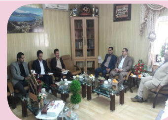
دیدار با فرماندار مریوان