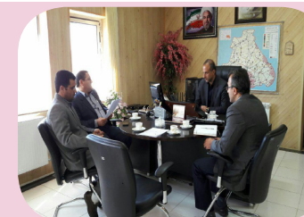
دیدار با فرماندار قروه