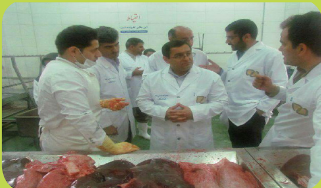
بازدید مدیرکل استاندارد از کشتارگاه صنعتی دام سنندج