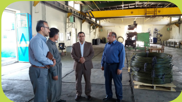
بازدید مدیرکل از شرکت جهاد زمزم