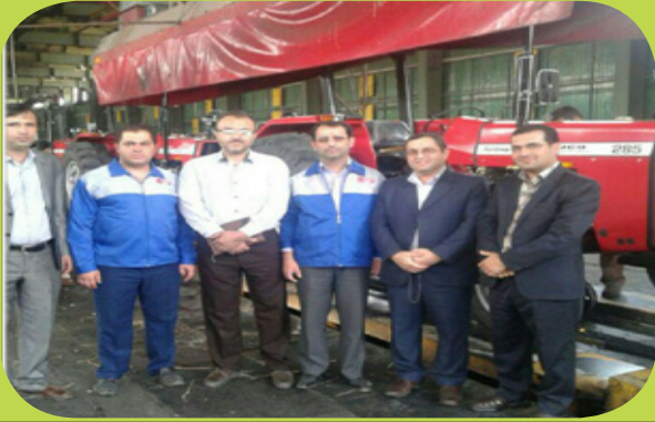
بازدید مدیرکل از خط تولید و مونتاژ تراکتورسازی کردستان