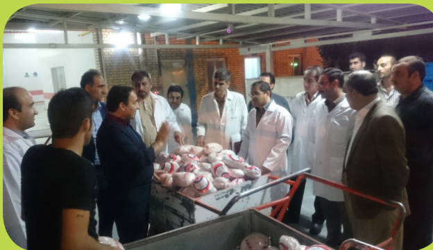
کشتارگاه مرغ بالداران زاگرس سنندج