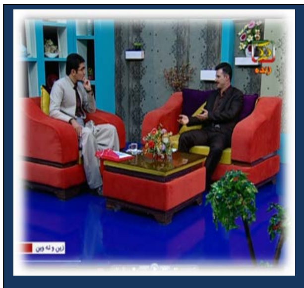
بطی رئیس اداره صادرات و واردات استاندارد کردستان