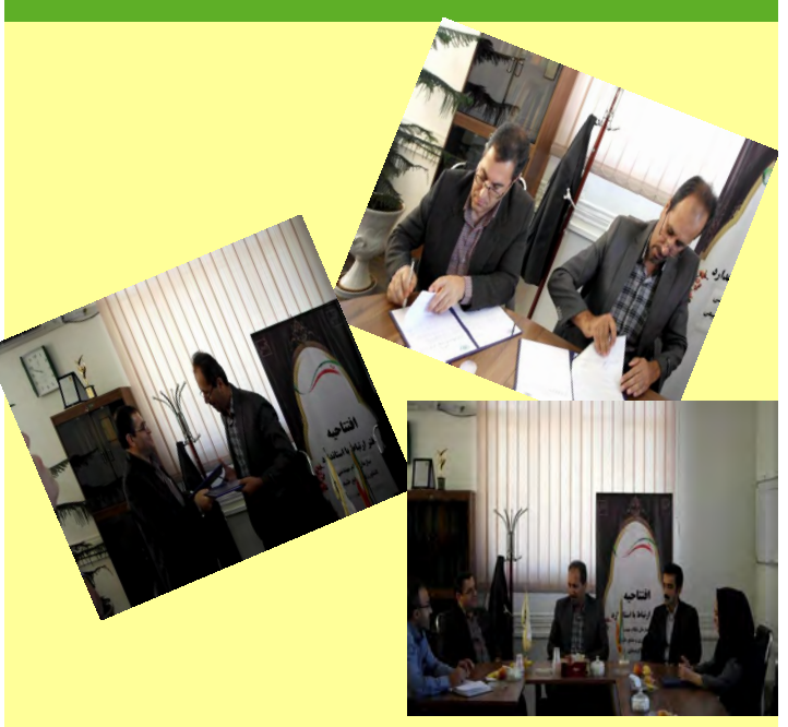
افتتاح دفتر ارتباط با استاندارد در دانشگاه آزاد اسلامی سنندج در مورخ ۹۵/۶/۲۱