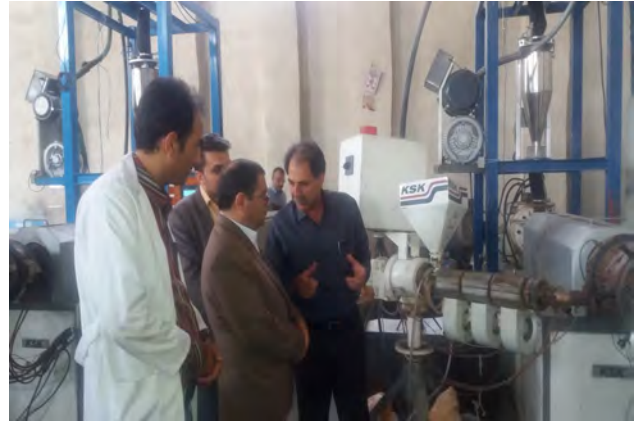
واحد تولیدی دریا لوله قره