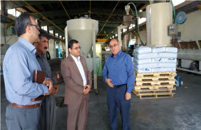
واحد تولیدی جهاد زمزم

در راستای نظارت بر عملکرد واحدهای تولیدی و آشنا شدن با مشکلات این واحدها، مدیرکل اداره استاندارد کردستان از واحدهای تولیدی، کشتارگاه و ... بازدید کرد.