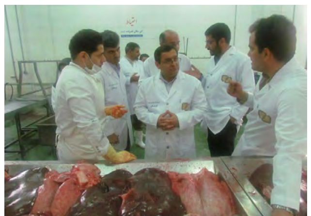
کشتارگاه صنعتی دام سنندج