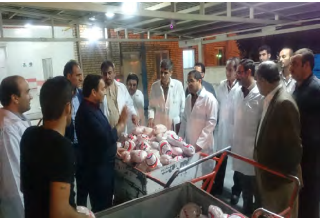
کشتارگاه مرغ بالداران زاگرس سنندج