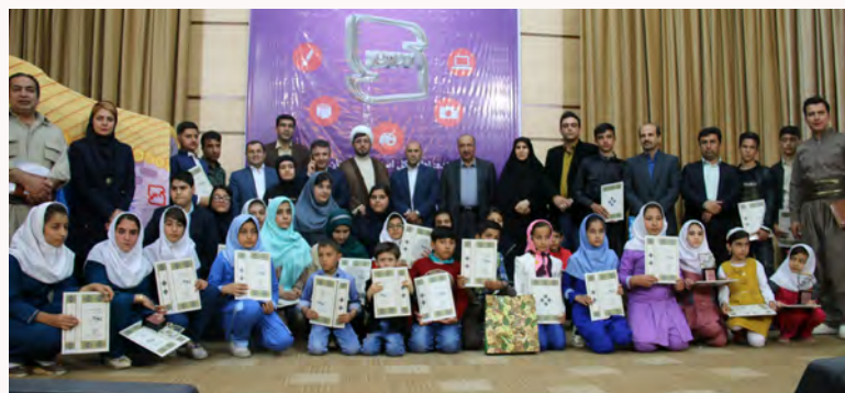
برگزاری جشنواره‌ی فرهنگی هنری پیوه‌ر