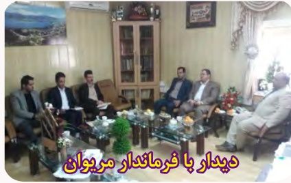
دیدار با فرماندار مریوان