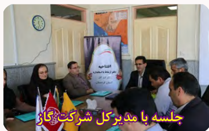
جلسه با مدیرکل شرکت گاز