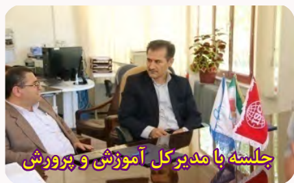
جلسه با مدیرکل آموزش و پرورش