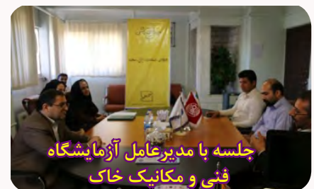
جلسه با مدیرعامل آزمایشگاه فنی و مکانیک خاک