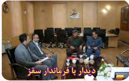
دیدار با فرماندار سقز