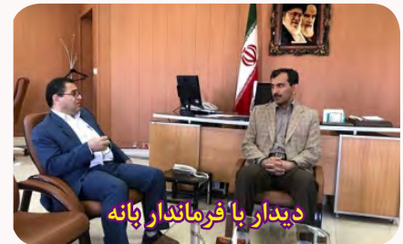
دیدار با فرماندار بانه