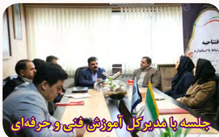
جلسه با مدیرکل آموزش فنی و حرفه‌ای