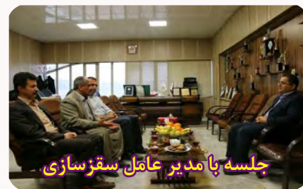
جلسه با مدیرعامل سقز سازی