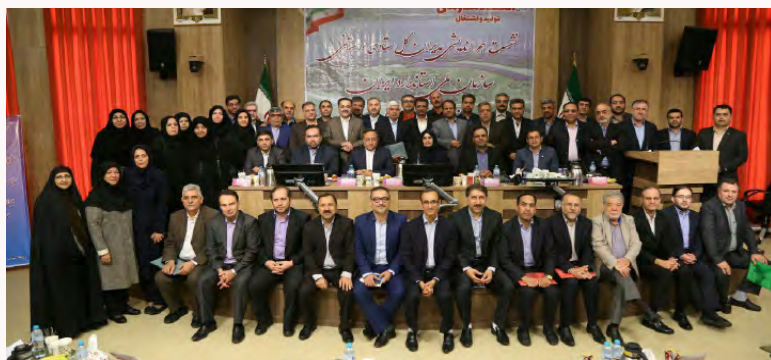
نشست هم‌اندیشی مدیران ستادی و استانی سازمان ملی استاندارد ایران