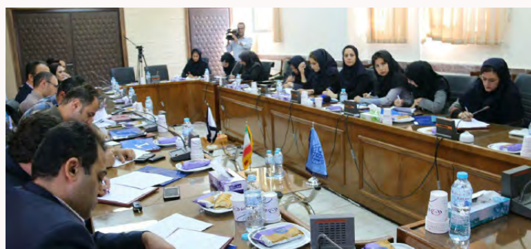
نشست خبری مدیرکل با اصحاب رسانه