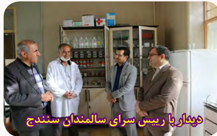
دیدار با رییس سرای سالمندان سنندج