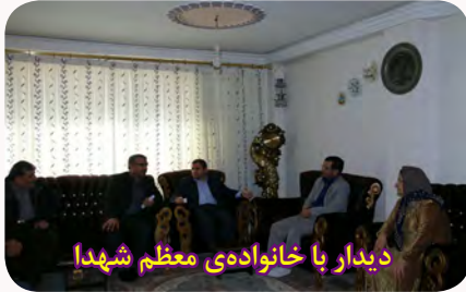
دیدار با خانواده‌ی معظم شهدا