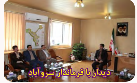
دیدار با فرماندار سنو آباد