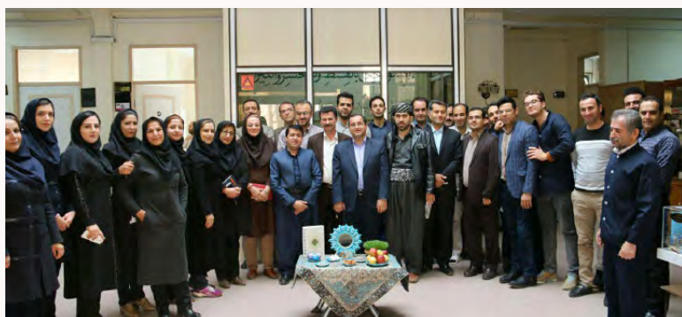
مجمع عمومی و مراسم پایان سال ۱۳۹۶